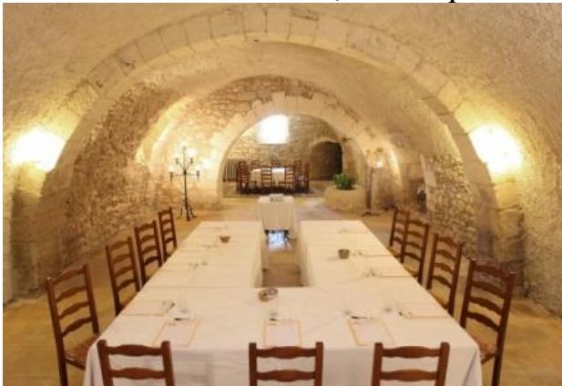
La salle Voûtée 100m 2 / 30 à 70 personnes