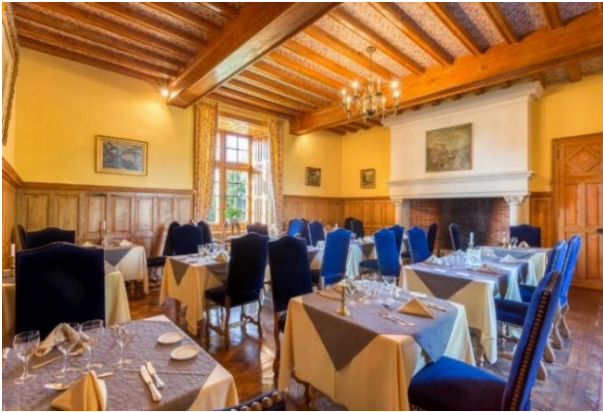
La salle Boisée 50m 2 / 35 personnes