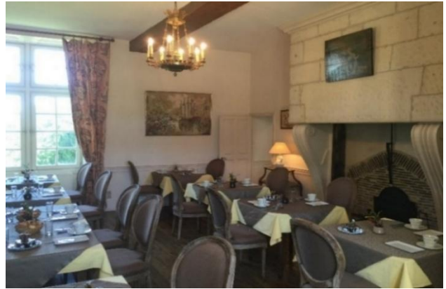
La salle de L'Evêque room 45m 2 / 30 personnes